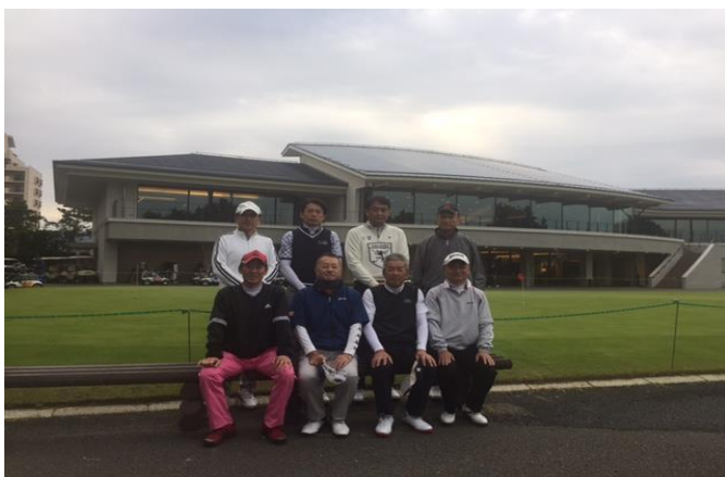
難コースに10人が参加