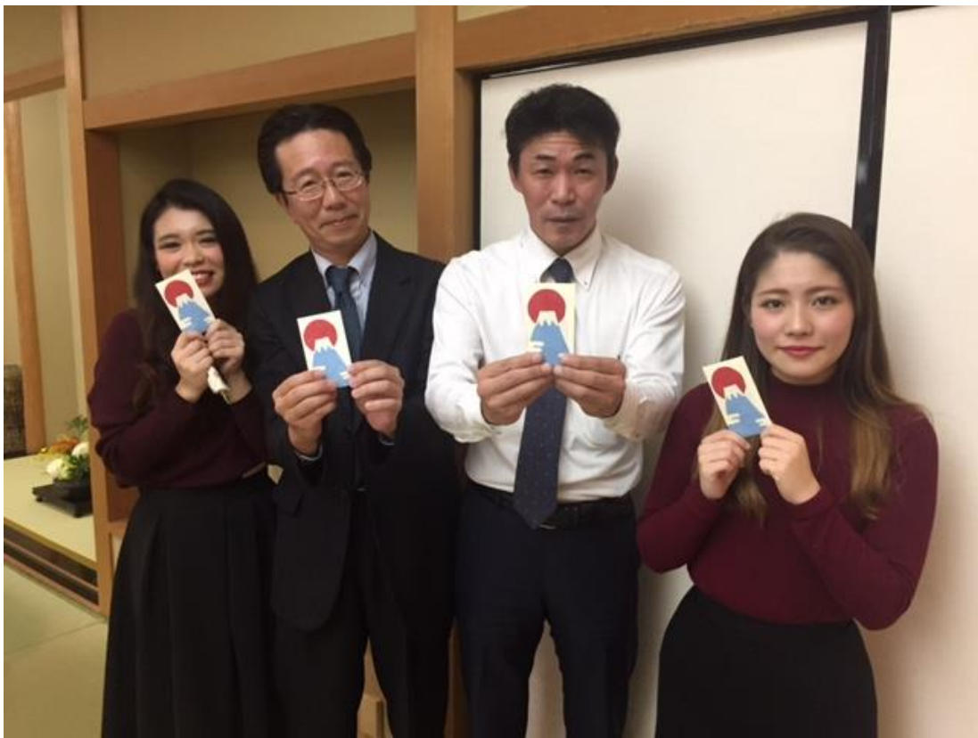
ジャンケン大会で見事に勝ち残った4人