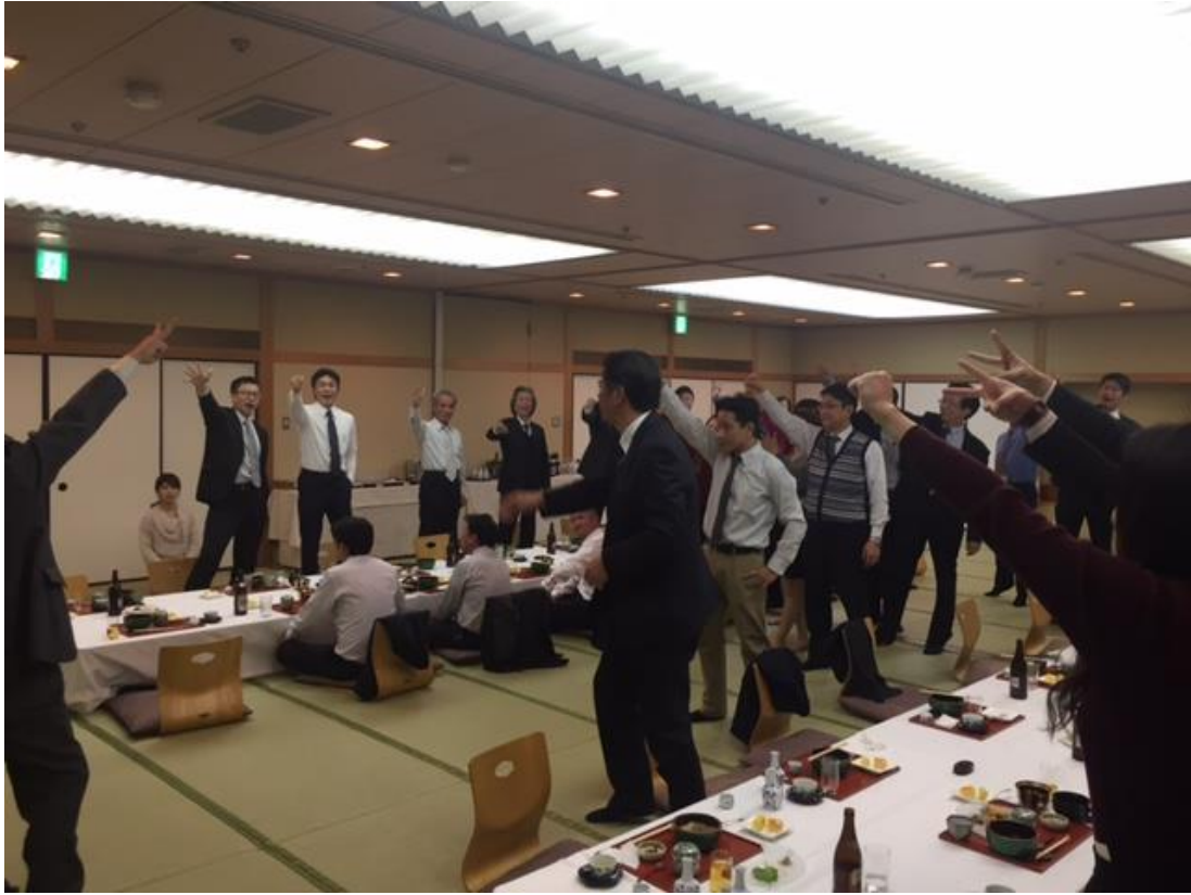
盛り上がったジャンケン大会