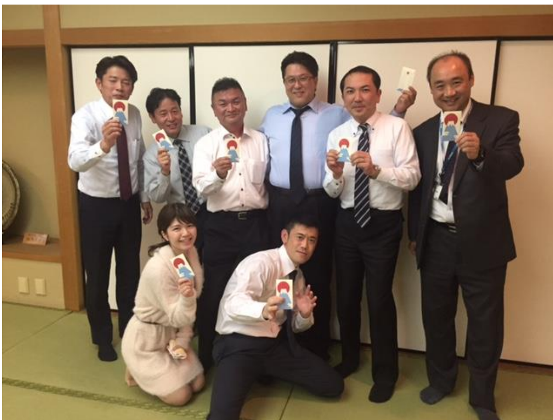
伝言ゲーム優勝チーム