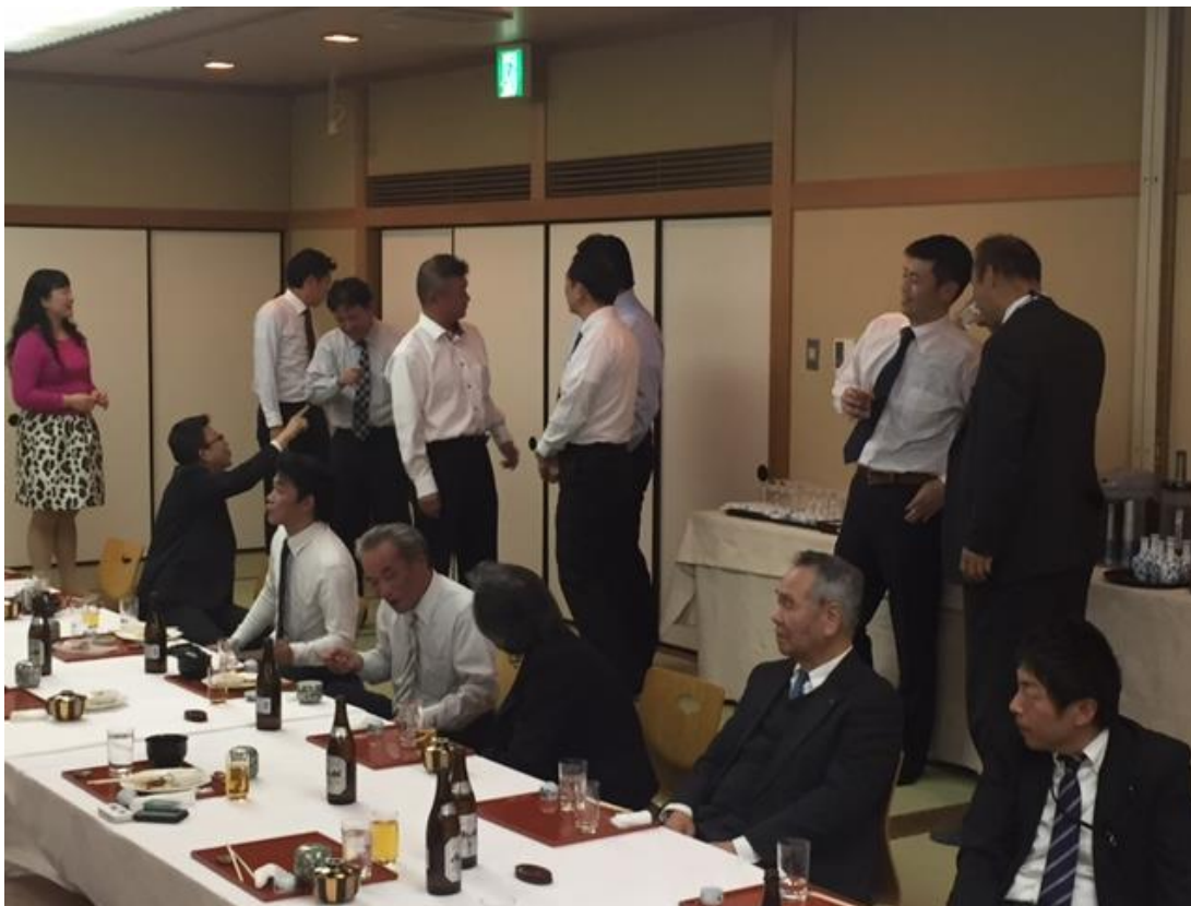
伝言ゲームに四苦八苦する出席者

恒例の九包材大忘年会は12月7日午後6時半から、福岡市博多区吉塚本町の博多サンヒルズホテルに25社32人が参加して盛大に行われました。ご出席ありがとうございました。